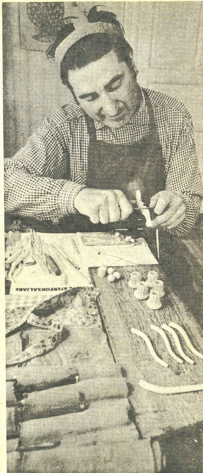
Med noggrannhet och exakthet kommer de olika sakerna till.