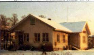
Hallabro station 1981