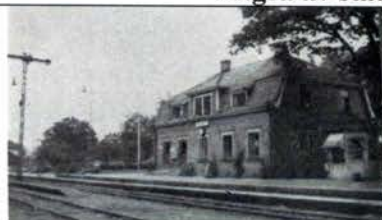
Tingsryd station omkr 1949