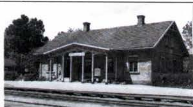
Bredåkra station 1940-tal