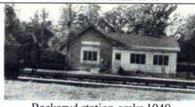
Backaryd station omkr 1949