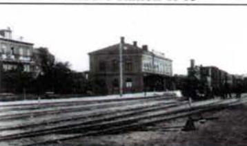
Ronneby station 1904