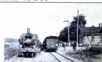
Hensmåla station ca 1900