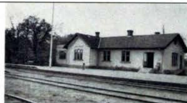
Konga station omkr 1949