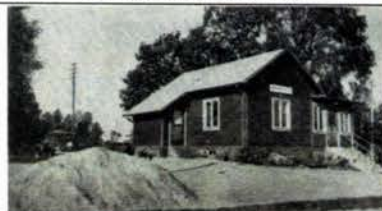
Vermanshult omkr 1949